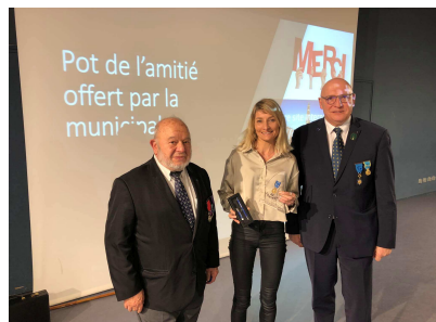
04/02/2023 AG CDMJSEA 62