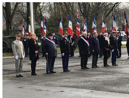
16/02/2023 VILLENEUVE D'ASCO hommage aux héros de la gendarmerie nationale